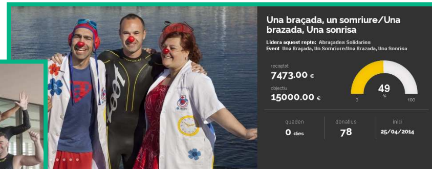
Travessa Solidària Menorca-Mallorca a favor dels Pallapupas a l'Hospital del Mar